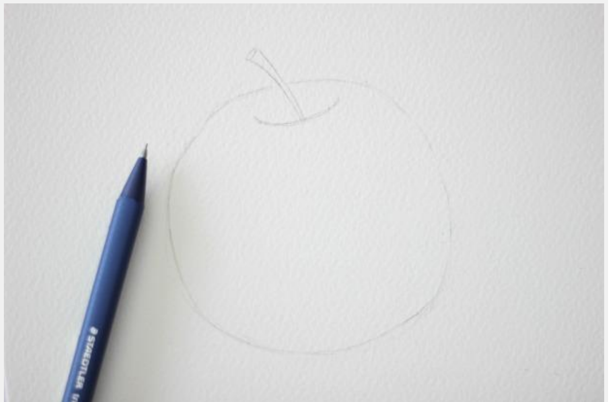
рисуем яблочко и определяемся с источником цвета