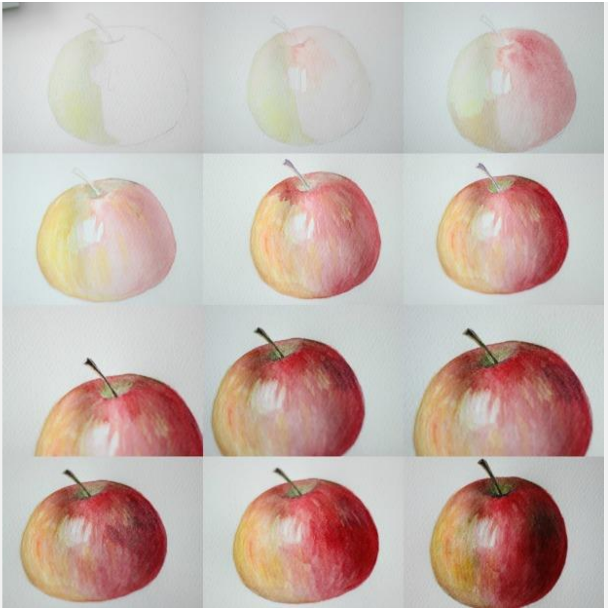
пошаговые фото, чтоб видеть процесс