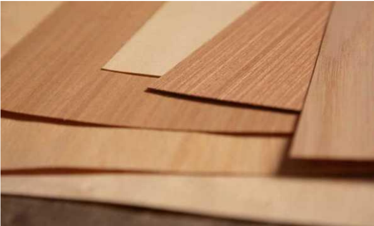
Так выглядят листы шпона

Маркетри (от франц. marquer - размечать, расчерчивать) вид мозаики по дереву, при котором мозаичный набор выполняют из кусочков шпона разных пород древесины.