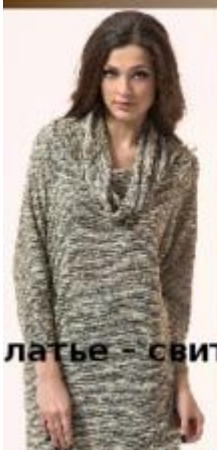
платье - свитер