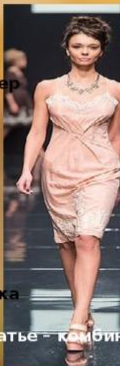
платье - комбинация