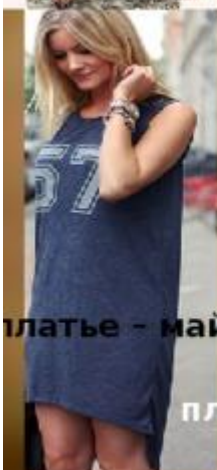
платье - майка