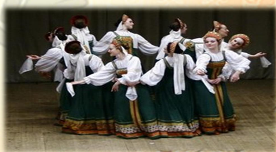
Русский хоровод «Веретёнце»