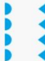
«улица» — Архангельская обл. «стенка» — Москва «проулочек» — Пермь