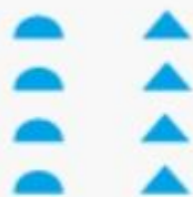
«колонна»; «шествие» — Архангельская обл.