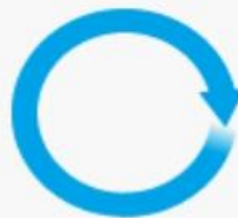
«круг»; «коло»; «колесо» — Смоленская обл. «шина» — Архангельская обл.