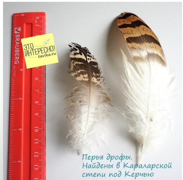
Перья дрофы. Найдены в Караларской степи под Керчью