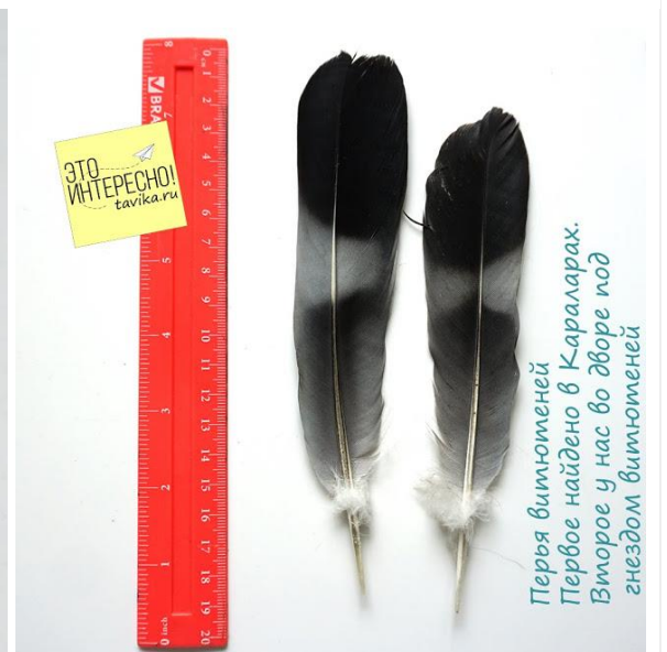
Перья витюменей Первое найдено в Караларах. Второе у нас во дворе под гнездом витюменей

Тут меня поправили в комментариях, что это не синица, а щегол.