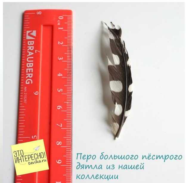
Перо большого пёстрого дятла из нашей коллекции