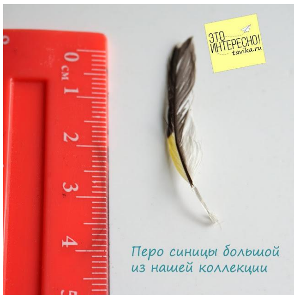
Перо синицы большой из нашей коллекции