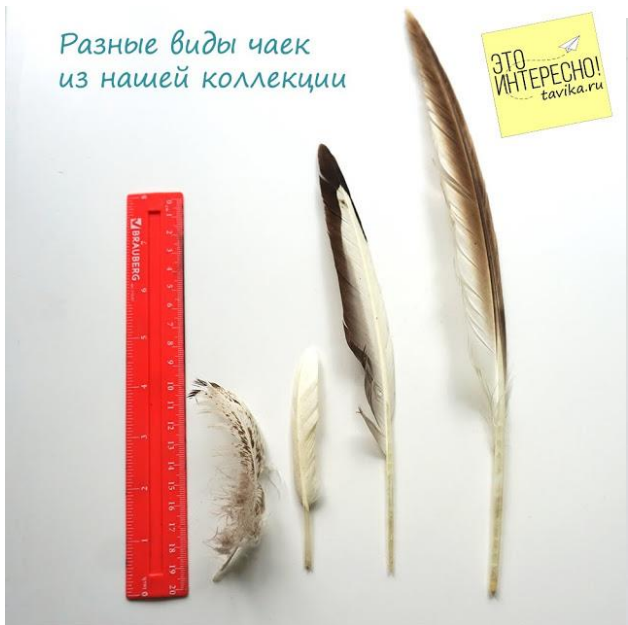
Разные виды чаек из нашей коллекции