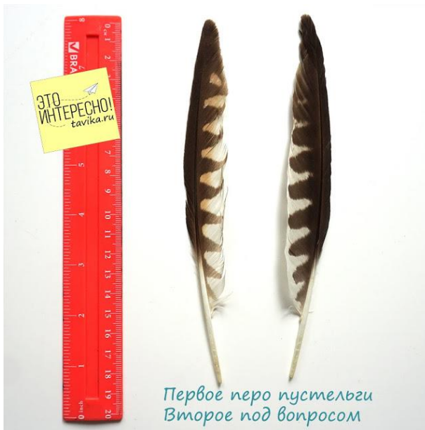
Первое перо пустельги Второе под вопросом