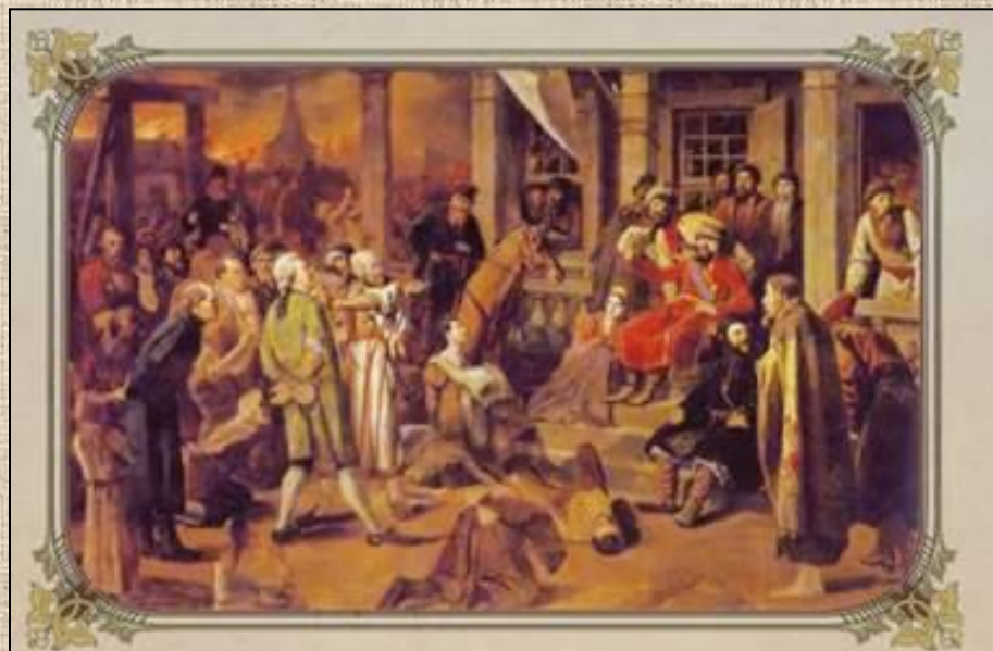
В.Г.Перов. «Суд Пугачёва» (1875)

В 1774 году Пугачев выдан властям заговорщиками и казнен в Москве на Болотной площади (рис. 7).