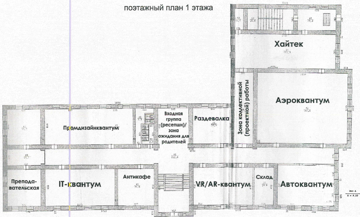
поэтажный план 1 этажа