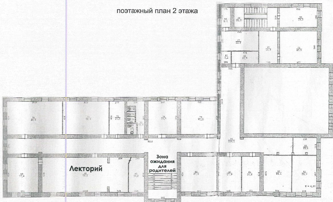
поэтажный план 2 этажа